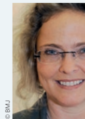
Claudia Bandion-Ortner Bundesministerin für Justiz

Eine Klarstellung gibt es schließlich auch im Bereich des „Anfütterns“: Dieses Delikt bleibt natürlich erhalten, es wird allerdings zu einem Vorbereitungsdelikt für pflichtwidriges Handeln umgestaltet. Strafbar ist daher, wer Vorteile zur Anbahnung der pflichtwidrigen Vornahme eines Amtsgeschäftes gibt oder annimmt. Denn ein wesentlicher Grundsatz der Gesetzesnovelle ist, dass Networking und Gastfreundschaft nicht per se kriminalisiert werden dürfen. Das bedeutet eine klare Absage an manche Forderungen, die letztendlich darauf hinauslaufen, alle Betroffenen per se einmal unter Generalverdacht zu stellen.