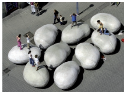
Blase in die Ecke 2004 Neue Galerie Graz