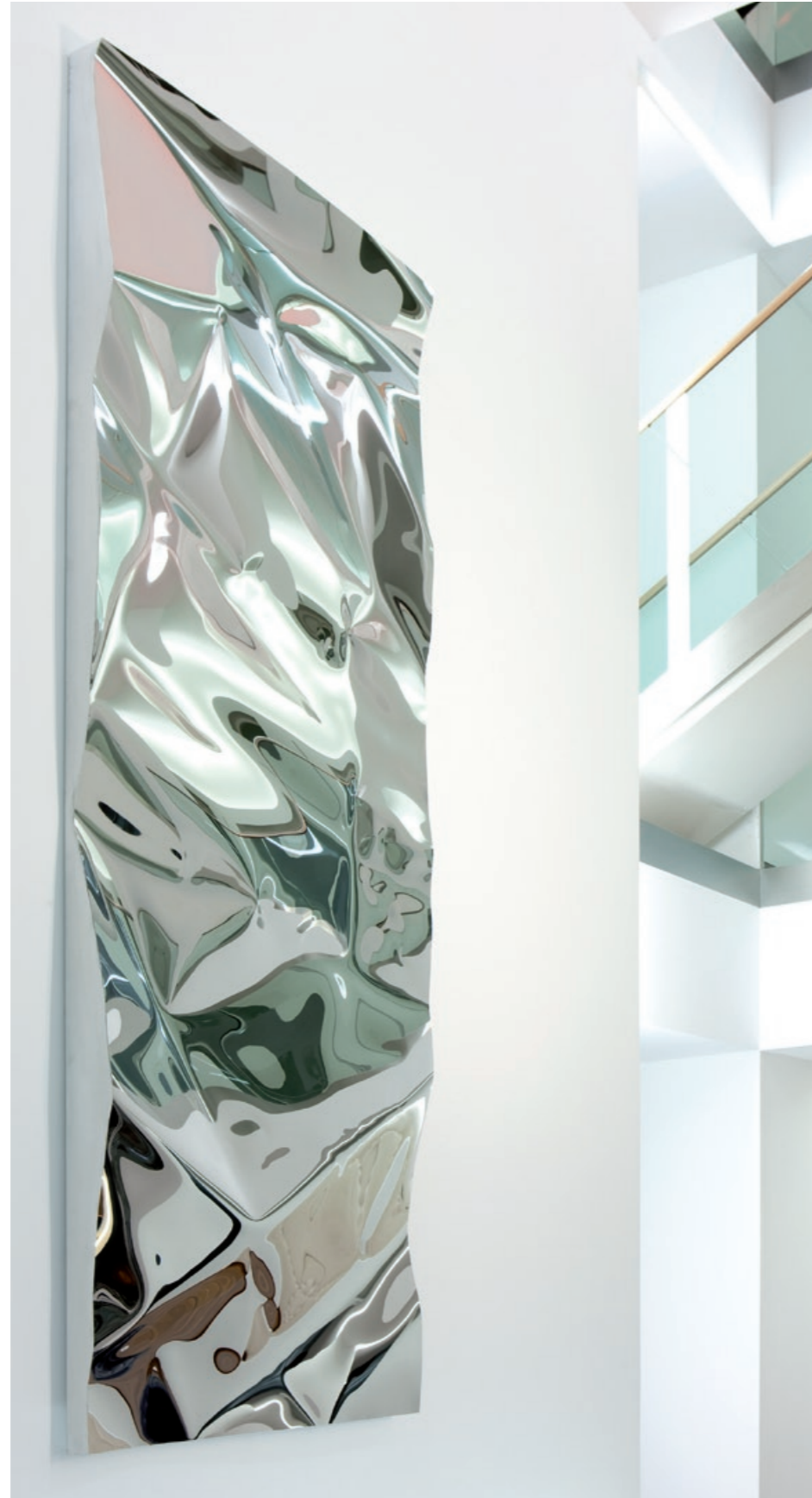
Spiegelrelief 2009 Conference Area Binder Grösswang, Wien